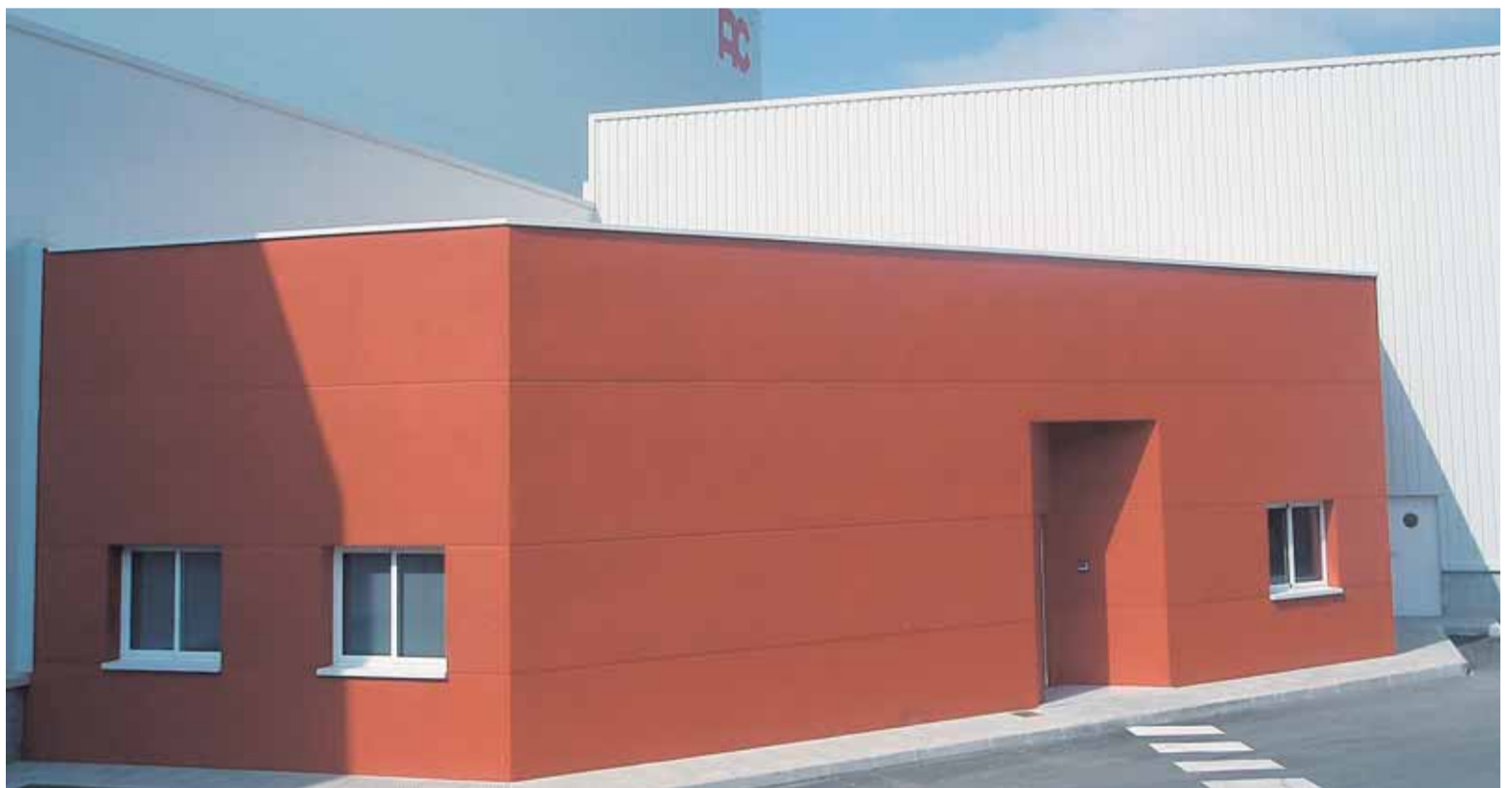
Fachada principal de Auxiliar Conservera, cuya construcción ha corrido a cargo de Omansa. Omansa

En Auxiliar Conservera también han ejecutado trabajos de obra civil de diversa índole en el almacén inteligente, las oficinas de la nave de expediciones y los accesos y la urbanización exterior del nuevo centro logístico de la empresa.